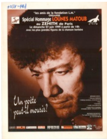
CARTEL (1999) : Spécial Hommage Lounes Matoub. Les amis de la Fondation Lounes Matoub. Paris. France. (1 ejemplar) – Digitalizado-

FOLLETO (2955/2005) : Diálogos con África. Conferencia de Chaquir Achahbar, Diálogo con Ouzzin Aherdan, Elena Acosta y Concierto de Akli. (2 ejemplares)