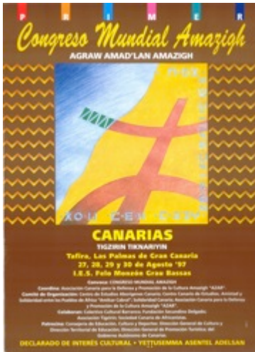
CARTEL (1997) : Primer Congreso Mundial Amazigh. Agraw Amad'lan Amazigh. Asociación Canaria para la Defensa y Promoción de la Cultura Amazigh "AZAR". Las Palmas de Gran Canaria. (20 ejemplares) – Digitalizado-