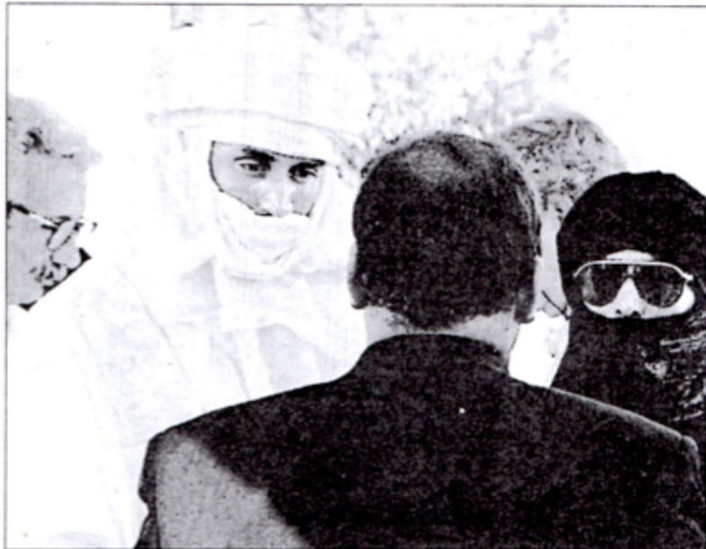
La reunión se celebró esta pasada semana en Las Palmas de Gran Canaria