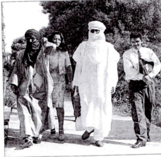
Um grupo de asistentes al congreso 'Amazigh'.

Los cálculos sobre la población aborígen antes de la conquista, en torno al 1400, arrojan cifras que van desde 30.000 habitantes, hasta los 100.000 que nos proporciona el padre Las Casas y que refrenda el profesor Antonio Macías. No obstante, ya desde el primer tercio del siglo anterior debió de producirse si no un decrecimiento, sí al menos un cierto estancamiento, debido a las razas esclavistas, al abandono de las zonas costeras debido a éstas, y sobre todo por las prevenibles epidemias, de las que hay referencias en la historiografía isleña. El bajón demográfico se producirá de manera acelerada a lo largo del siglo siguiente en que se consuma la ocupación del territorio, y aún en los primeros años del XVI. Los datos son incuestionables; así las razas esclavistas que desde los puertos andaluces y las islas conquistadas, se rea-