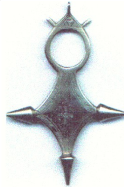
La famosa Cruz de Agadez de los tuareg