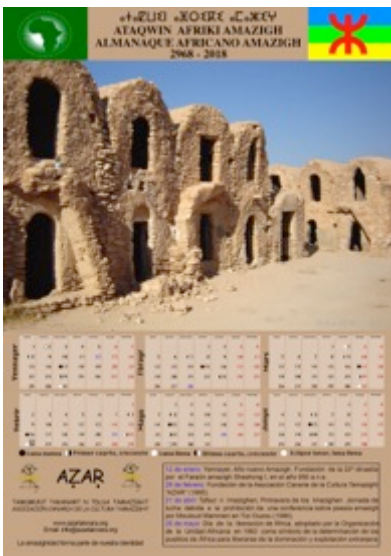
Diseño: Juan Salvador Sosa Medina