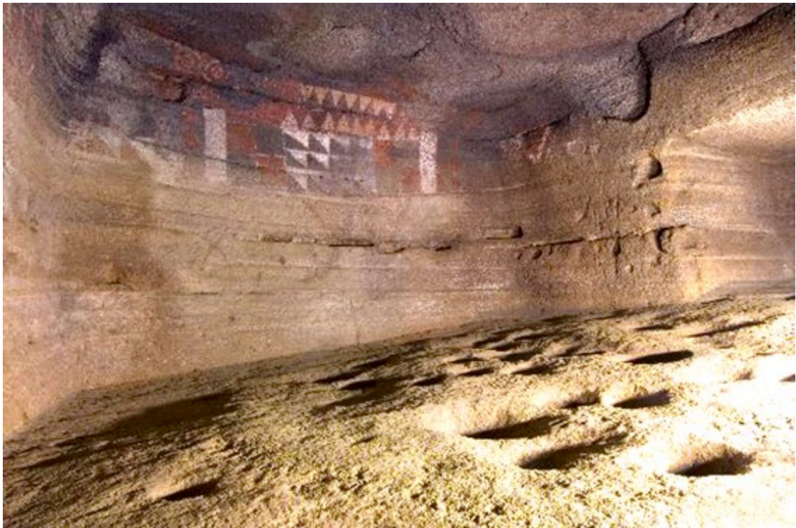
CUEVA PINTADA, AGALDAR

MUSEO Y PARQUE ARQUEOLÓGICO CUEVA PINTADA