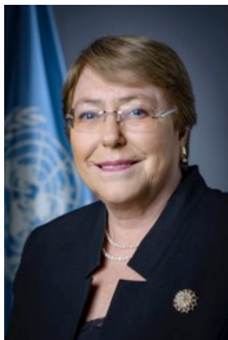
Michelle Bachelet Rachid Raha

Acaba de ser nombrada Alto Comisario de Naciones Unidas para los Derechos Humanos. Por este motivo y, ante todo, deseamos felicitarla calurosamente y deseárselo mucho éxito en el cumplimiento de sus deberes en esta nueva, difícil y noble responsabilidad al frente de la más alta instancia de los derechos humanos de las Naciones Unidas.