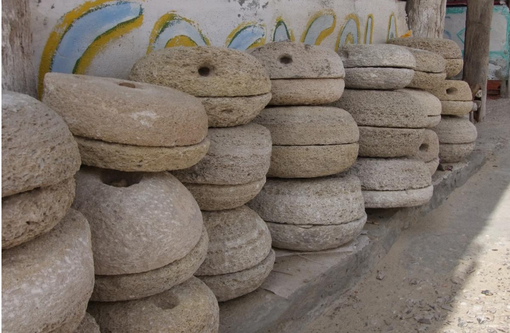
Molinos de Piedra. Túnez