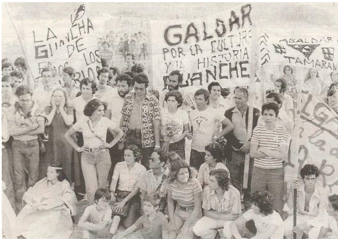
Una parte del grupo de manifestantes que participaron en la protesta en julio de 1976.